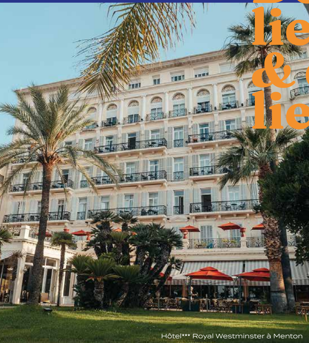
Hôtel*** Royal Westminster à Menton

Avec Vacances Bleues , découvrez des lieux d'exception en France :